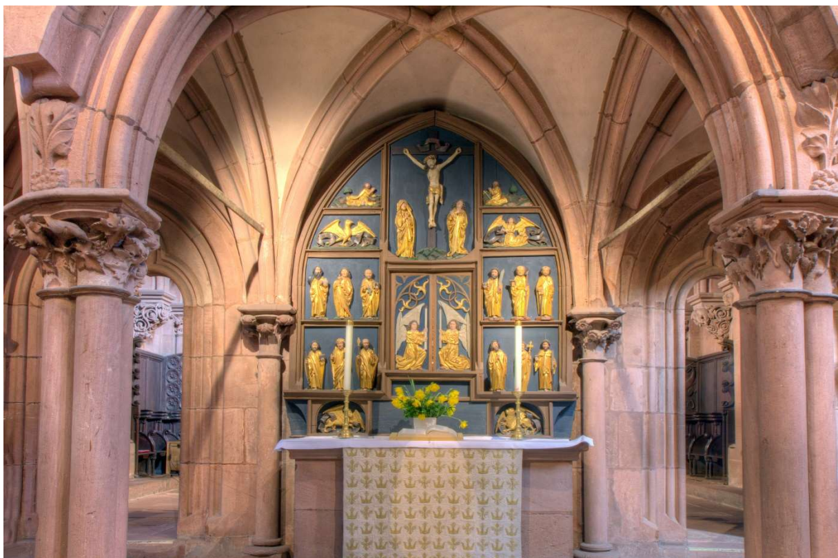
Laienaltar mit den zwölf Aposteln und den vier Evangelisten

In der Mitte der Laienaltar mit den vier Evangelisten und den zwölf Aposteln.